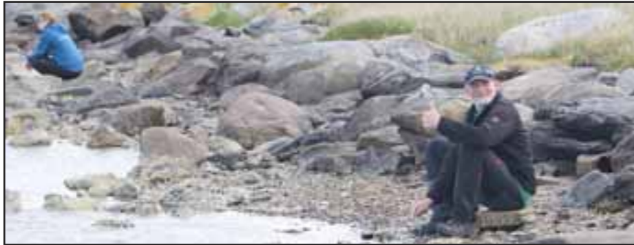
Hjelperne er klar på stranda

Vi delte oss opp slik at 3 hunder søkte fra båt og de resterende 5