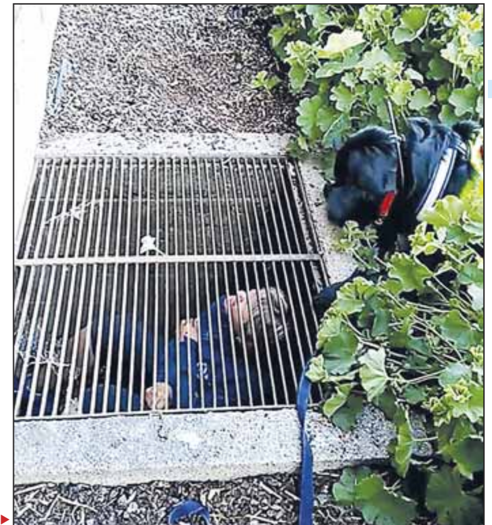
Bilde 3: Ingen gjemmesteder er utenkelig ▶

Søk hele området, ikke «tenke» så mye på hvor den savnede kan være. Er det vanskelig «søksforhold» for hund, så får Hundefører gjøre gode taktiske vurderinger og søke mer selv, eventuelt be om bistand fra andre ressurser. Det er viktig å kunne søke i line og med lav intensitet i de vanskelige områdene. Bli man forstyrret, så gå «tilbake» i søksområdet, når forstyrrelsen er borte. Lykke til med treningen, bruk fantasien.