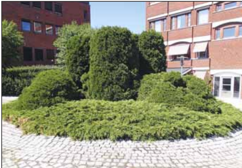
▲ Bilde 1: Hvor trener vi

Det ble organisert en trening i slutten av mai. 2018 hvor tema var Urbansøk, og området var Ski sentrum. For å «bevise» hvor gode hundene er til å skille ut det som «annerledes», ble det lagt ut gjenstander i en rundløype, med