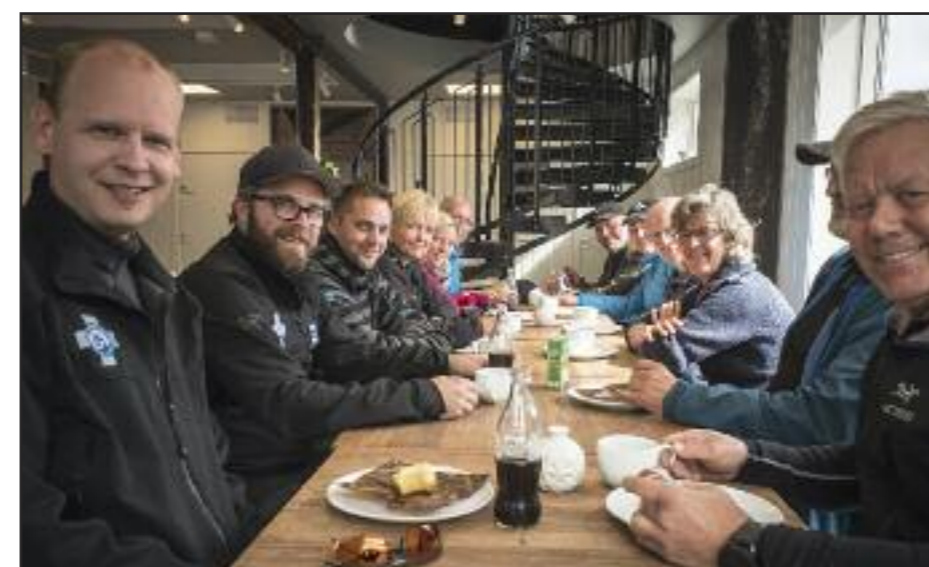
Men lange dager (og kvelder) er det faktisk sånn at man fortjener en liten pause på et av Røros sine bedre bakerier:)

Så var det øvelse på Røros. Siden kurset gikk samtidig med HKEMN og kommende / regodkjennende