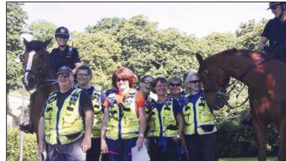
Forsøksvis lagbilde av alle deltakerne, inkludert HF-kollega fra nabolaget til øverst til venstre.