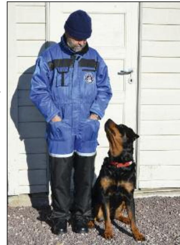
Det handler mer om relasjoner enn om plass i hierarkiet.

Før vi ser på den vanlige oppfattelsen av lederskapstrening og hvordan denne påvirker familiehunden vår, mener jeg at det er verdt å ta en titt på hvordan de oppsto og hvorfor mennesker har blitt så besatt av idéen om at hundene ønsker å være dominante. Lederskapstrening, som også er kjent som "flokkreglene", er basert på ulveflokkens sosiale, hierarkiske struktur som er nedarvet gjennom generasjoner. Det betyr med andre ord at hvis det er slik en ulv oppfører seg, så vil en hund oppføre seg på samme måte. Imidlertid er det slik at flokkadferden til ulver i fangenskap skiller seg en del fra den hos naturlig frittlevende ulveflokker. I en frittlevende ulveflokk er det kun alfa-hannen og alfahunden som føder og oppdrar sine avkom. I en slik flokk ville avkommet forlate flokken