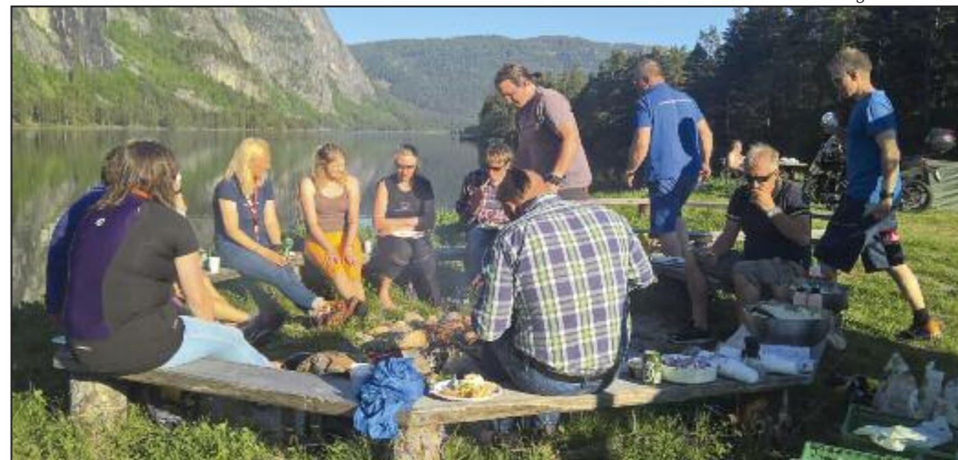
Grilling i strålende vær