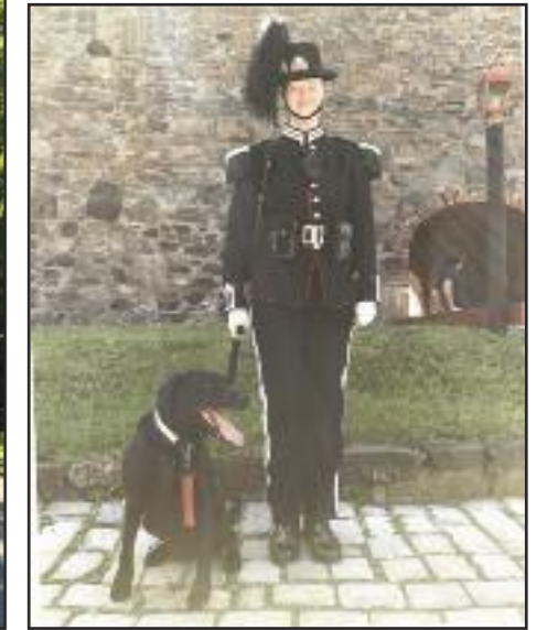
Bursdags-Bonus slo av en prat med en annen uniformert.