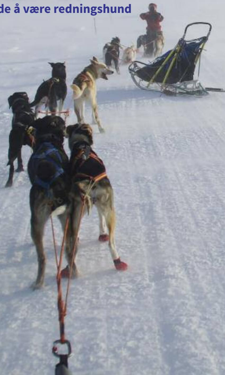
Geir og Aurora.