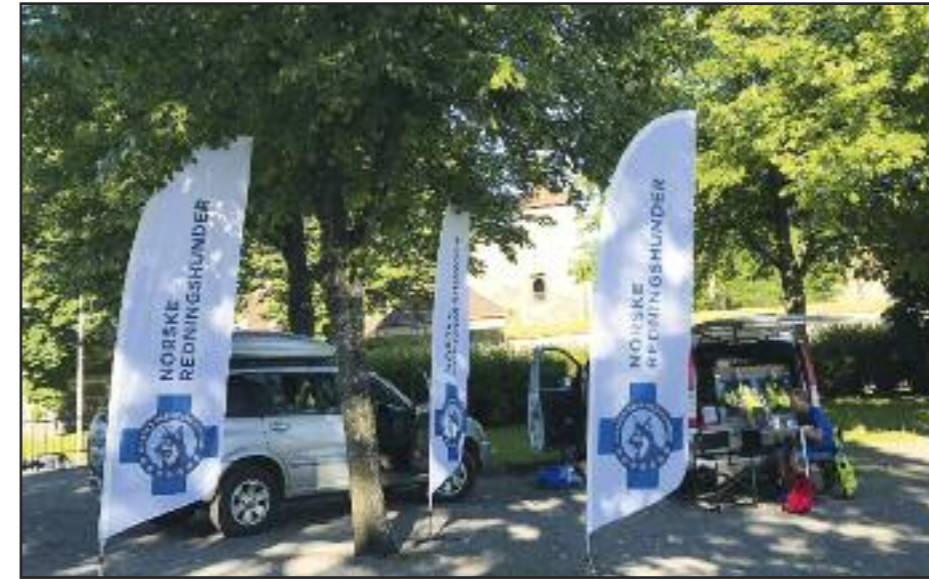
God reklame for NRH!!

det gikk mennesker inn og ut. Jeg trodde jo selvsagt at det var disse han slo på, men i det jeg runder hjørnet, stuper hunden 90 grader og bare noen meter fra inngangsdøren bak noen stoler, ligger figgen som var indikert på andre siden av kontaineren. Hvordan greier de skille?