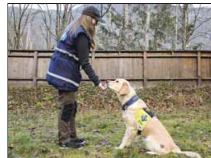
Omvendtlokking 1: Vis fram godbiten i hånden din. Lukk hånden om hunden prøver å ta godbiten.

Når jeg skal ta omvendt lokking videre inn i sitt og bli har jeg først lært inn hva kommandoen «sitt» betyr. Jeg kommanderer så «sitt» og viser fram godbiten. Gjentar samme prosedyre som over, bare at nå er kravet i tillegg til å ikke ta godbiten at rumpa skal være nede i bakken. Når hunden sitter fint med god vekt på rumpa sier jeg «vær så god» og gir godbiten til hunden. Har du en valp eller en litt mindre hund som «popper» litt opp