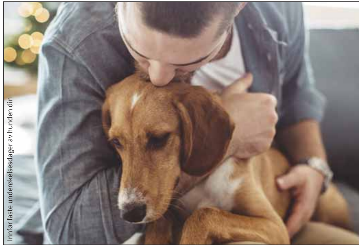
Innfør faste undersøkelsesdager av hunden din