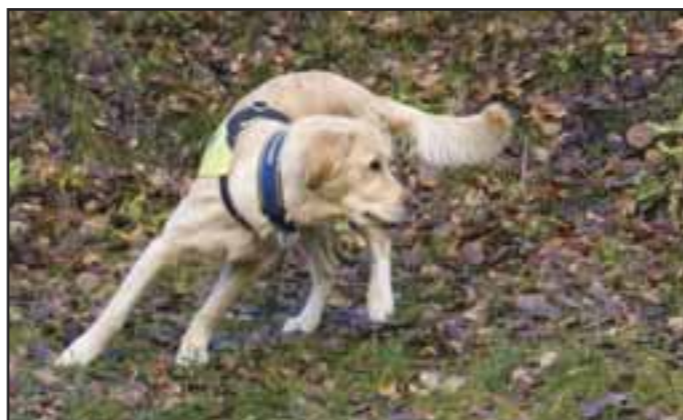
Innkallingskontaktøvelsen 3: Når hunden har svelget godbiten – ros og rygg vekk fra den.