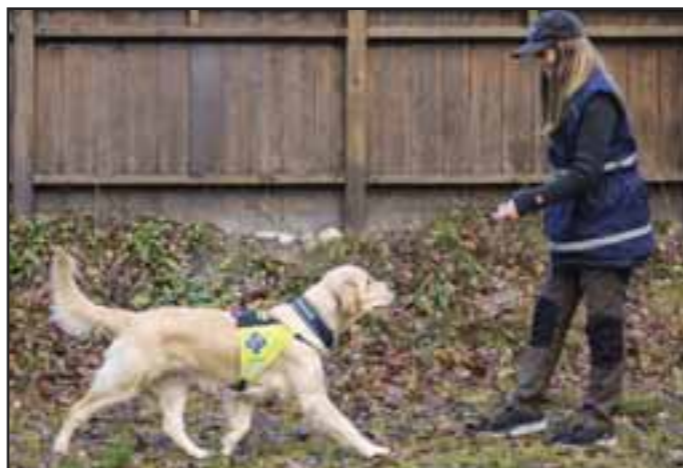
Innkallingskontaktøvelsen 4: Fortsett å rose og rygge mens hunden kommer mot deg.