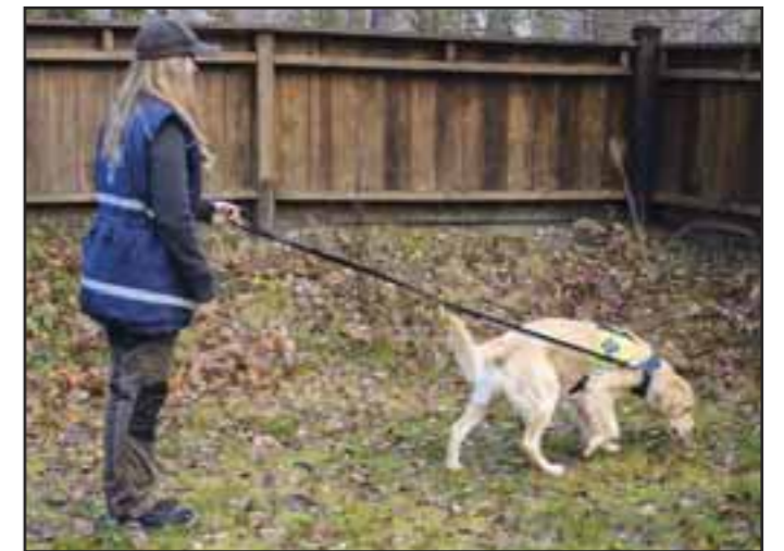
Ryggeøvelsen 1: Start å rygge når hunden har fokus vendt bort i fra deg.