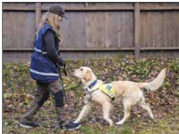
Ryggeøvelsen 2: Ros så fort hunden er vendt mot deg. Belønn!.

Grunnen til at jeg skriver at du ikke skal si noe til hunden når du starter å rygge er at jeg selv ønsker en hund som naturlig tar kontakt med meg uten at jeg trenger å be/mase om det. Etter hvert som jeg starter med Lineføring/Fri ved fot, legger jeg heller på kommandoen når hunden allerede utfører adferden (= «døper» adferden), og så belønner jeg det. Etter samme prinsipp som at jeg ikke sier «sitt» før hunden har rumpa i bakken under innlæringen av sitt. Når jeg begynner å legge på Lineføring/Fri ved fot-kommando begynner jeg også å gjøre tydeligere når øvelsen er over. Da bruker jeg et utløser-ord, for eksempel «yess!», rygger fort bakover noen steg før jeg belønner med leke eller godbiter.