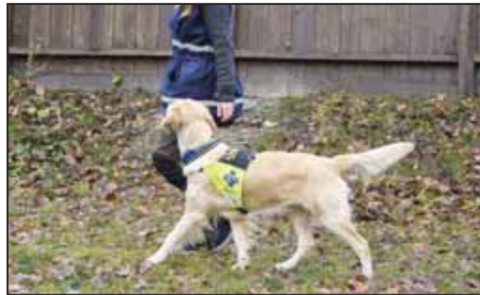
Fri ved fot 1