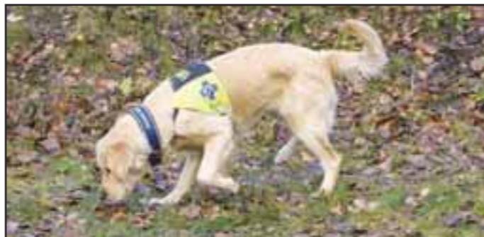
Innkallingskontaktøvelsen 2: Hunden løper ut og finner godbiten. belønner hunden.

Når hunden har skjont øvelsen og den flyter uten at du trenger å hjelpe den med båndet (selv når du kaster godbiten lenger og lenger vekk i fra deg) kan du legge på innkallingskommando når hunden snur seg og er på vei mot deg. Når øvelsen flyter fint kan du også prøve å koble av hunden og trene med den løs der hvor det er