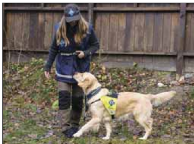
Ryggeøvelsen 3: Når hunden har skjønnet at det lønner seg å holde kontakten med deg når du rygger, snu deg 180 grader mot venstre så hunden kommer på din venstre side. Belønn når den er i den posisjonen du ønsker for lineføring/fri ved fot.