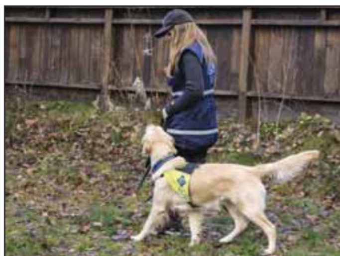
Ryggeøvelsen 4: Etter hvert som hunden blir stadig flinkere til å holde kontakten kan du ta utvide antall steg du går framover før du belønner hunden.