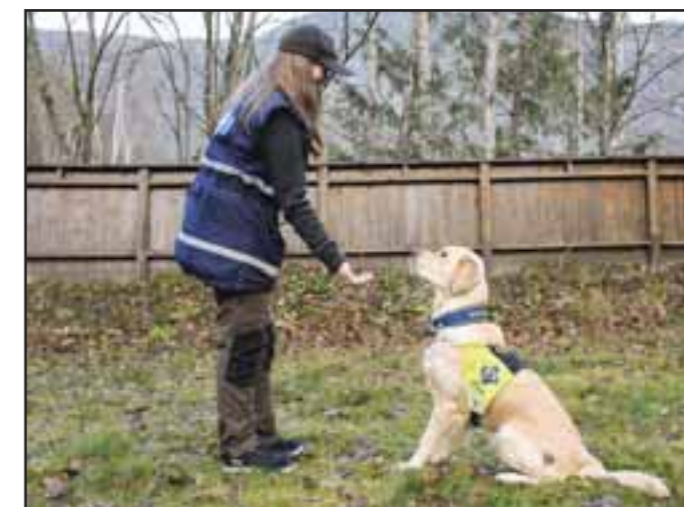
Omvendtlokking 2: Ros og si «vær så god» når hunden slutter å prøve og ta godbiten.