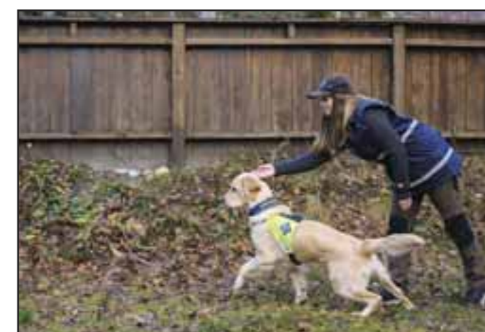
Innkallingskontaktøvelsen 1: Vis hunden at du har en godbit i hånden. Kast godbiten et stykke vekk fra deg.