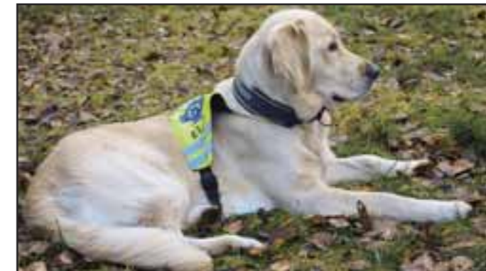
Bli på plass skjult fører

forstyrrelser – lær hunden å ligge i ro lenge selv når det er kjedelig og ingenting aktivitet å følge med på. Tren på å bli på forskjellige underlag (inkludert våte underlag i tilfelle det har regnet dagen du skal opp til prøve). Tren med skjult fører, gjerne med en medhjelper som kan varsle deg om hunden beveger seg. I «Bli med forstyrrelser» i Praktisk Lydighet skal dommer stå igjen (på ca. 10-30 meters avstand) når du går i skjul, så at en person står igjen og følger med på hunden er ikke ulikt hvordan det er på prøven.