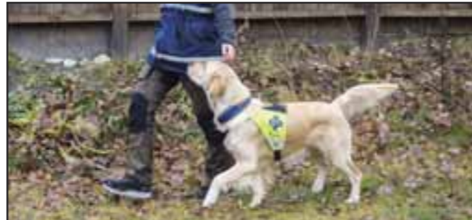
Fri ved fot 2

med forstyrrelser» uten en viss grad av kontakt med hunden. Kontaktøvelsene under er mine tre favoritter på grunn av deres store potensiale for videreutvikling og bruk i innlæringen/forbedringen av flere andre øvelser/momentene senere. Jeg starter med dem allerede når hunden er valp, og tar de med meg gjennom hele livet til hunden.