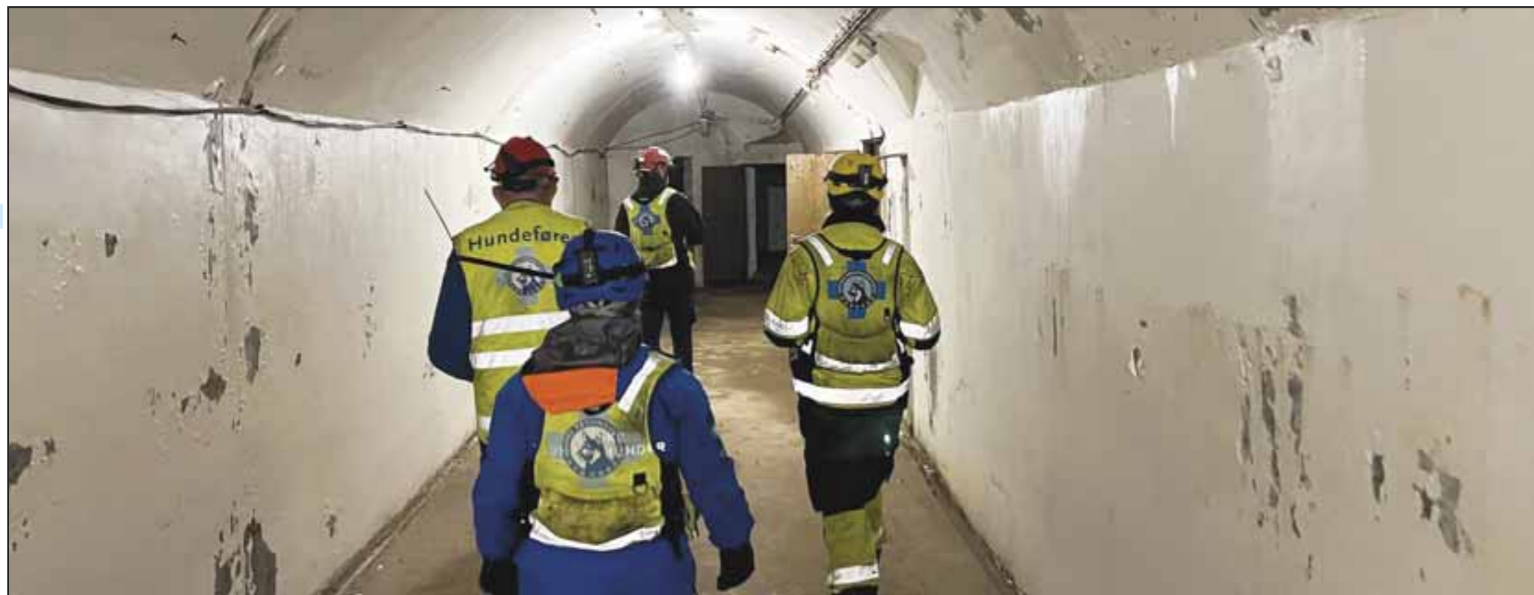
▲ Hovedkurs USAR i Vestby

Ved kurset slutt kan vi se tilbake på en uke som har vært krevende for både to- og firbeinte. Det er derimot