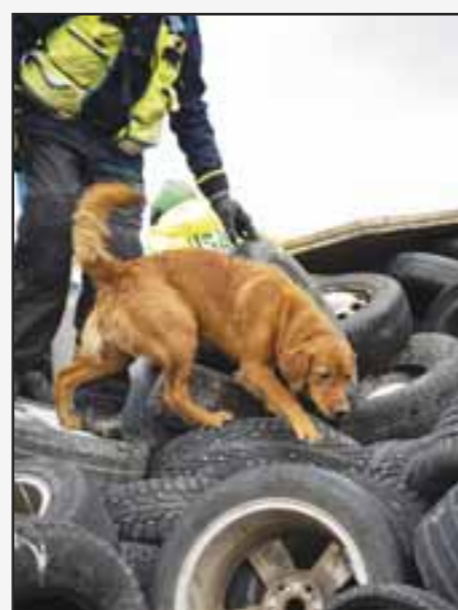
▲ Vilje (7 mnd) i dekkhaugen