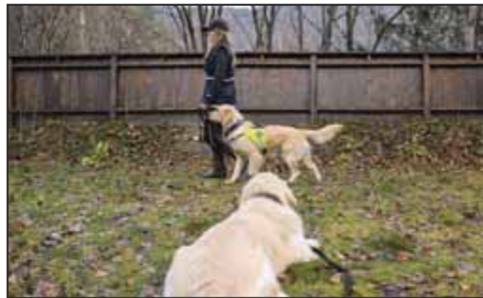
Møtesituasjon annen hund