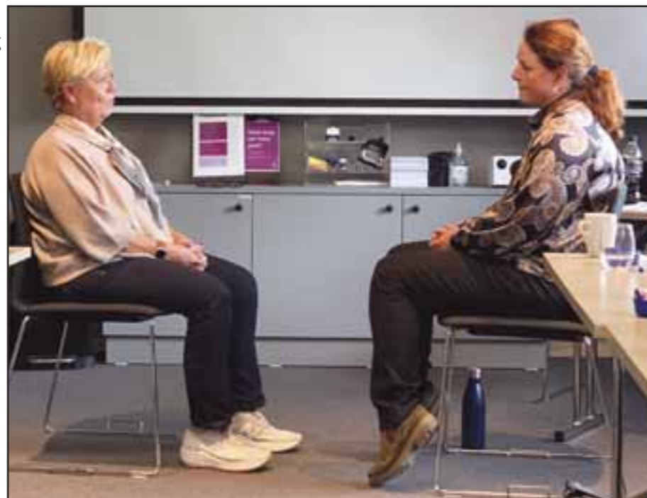
▲ Lise i samtale-demostrasjon.

Nå som kameratstøtte-instruksene er sendt til Hovedstyret for beslutning, etter høring – så er det formalisering av gode samarbeidsrutiner med beredkapsrollene som står på agendaen. Felles praktiske beskrivelser av kommunikasjon, organisering, rutiner osv. skal samles og videreutvikles slik at det gjenspeiler god praksis. Her ønsker jeg meg at også bered-