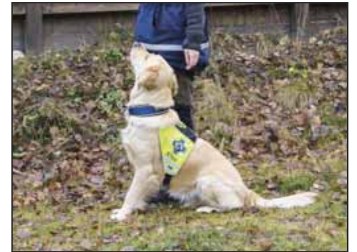
Fri ved fot 3

4. Når hunden har skjont at det lønner seg å vende kontakten mot deg når du rygger: rygg, og når du har en god kontakt med hunden – snu deg 180 grader mot høyre slik at hunden kommer inn på din venstre side. Belønn her når hunden faller inn i riktig posisjon ved