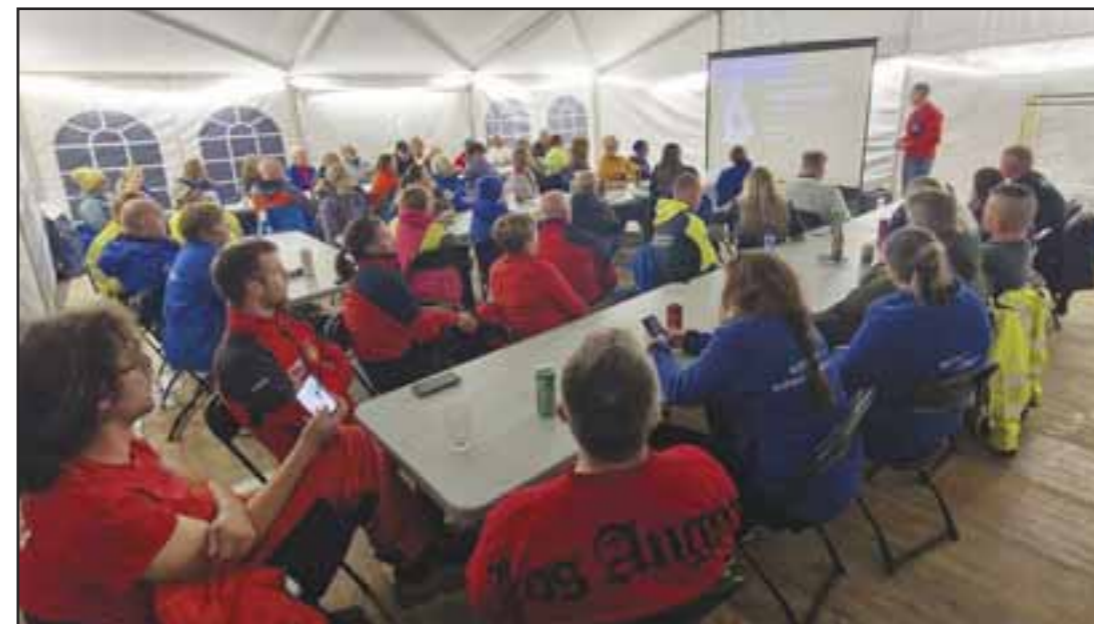
▲ Foredrag internasjonale gjester.

misfornøyd med. Eksempelvis når den firbeinte finner på ting den ikke har gjort før, eller når man selv må erkjenne at man kanskje ikke var den beste bidragsyter på den aktuelle oppgaven. Heldigvis så er de firbeinte tålmodige. Når man i tillegg er på lag med en gjeng med optimister fulle av pågangsmot så er det virkelig rom for å lykkes.