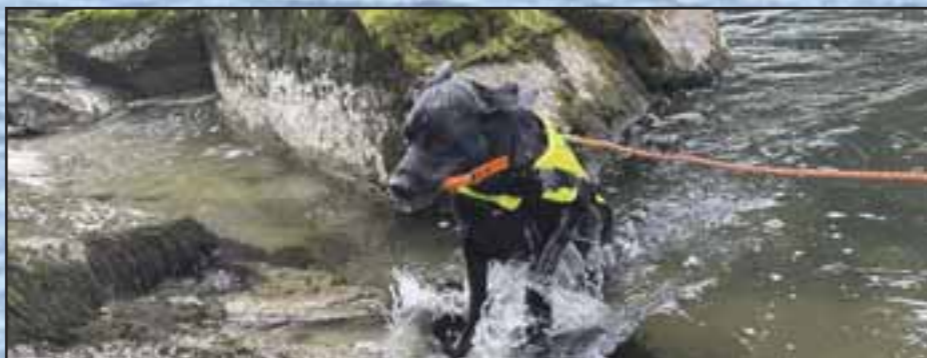
Nitro med melding

I utgangspunktet ville eg ha stoppa her og ikkje latt han gå vidare ut i elva, men for øvingsmomentet sitt