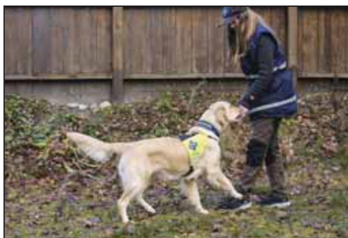
Innkallingskontaktøvelsen 5: Belønn hunden ryggende inne hos deg før du kaster en ny godbit.

forsvarlig. Gjør akkurat det samme uten bånd som med bånd. Legg etter hvert på forstyrrelser og tren i ulike miljø. Du kan godt variere ved å innimellom belønne med leke inne hos deg om hunden din er glad i å leke. Bare husk å rose og rygge først så det er tydelig at det er det at den kommer til deg du belønner. Fortsett å rygge litt mens du gir hunden leken for å gjøre det tydelig at det er at hunden beveger seg mot deg du ønsker å belønne.