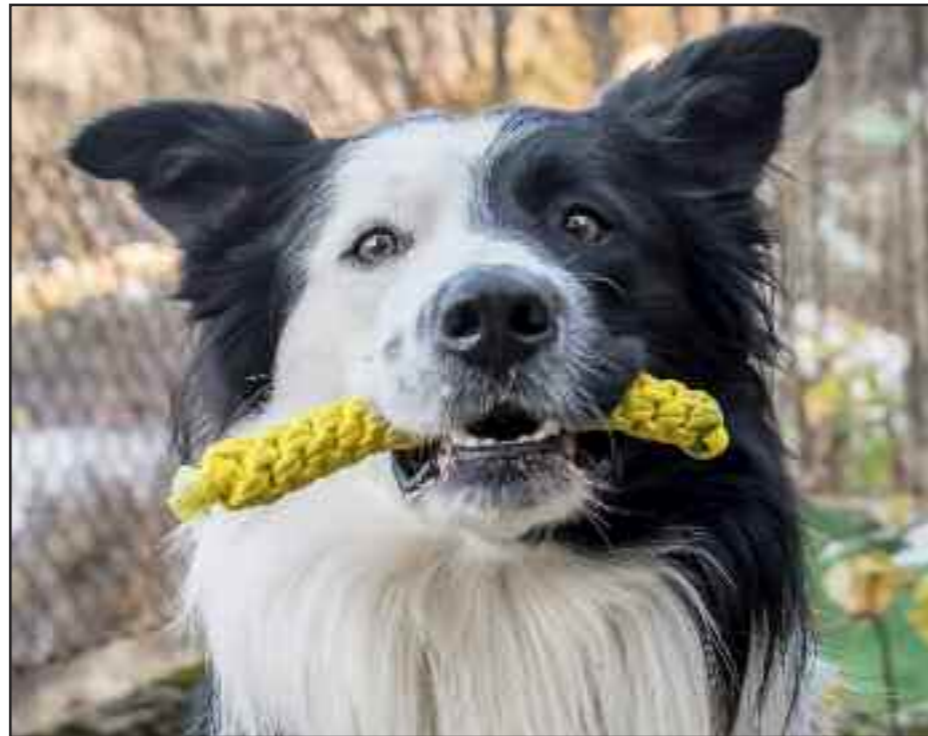
Mange sliter med å få hunden til å holde bittet til den får beskjed om å slippe. Er grunntreningen i apport for dårlig?

Pass på at du aldri fører apport-gjenstanden inn i munnen på