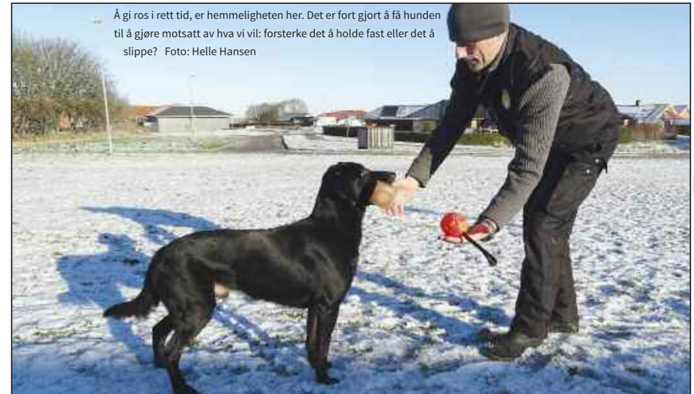
Å gi ros i rett tid, er hemmeligheten her. Det er fort gjort å få hunden til å gjøre motsatt av hva vi vil: forsterke det å holde fast eller det å slippe?

For å trene denne variasjonen må hunden først beherske de tidligere variasjonene av å holde fast, og i tillegg og alle variasjoner av