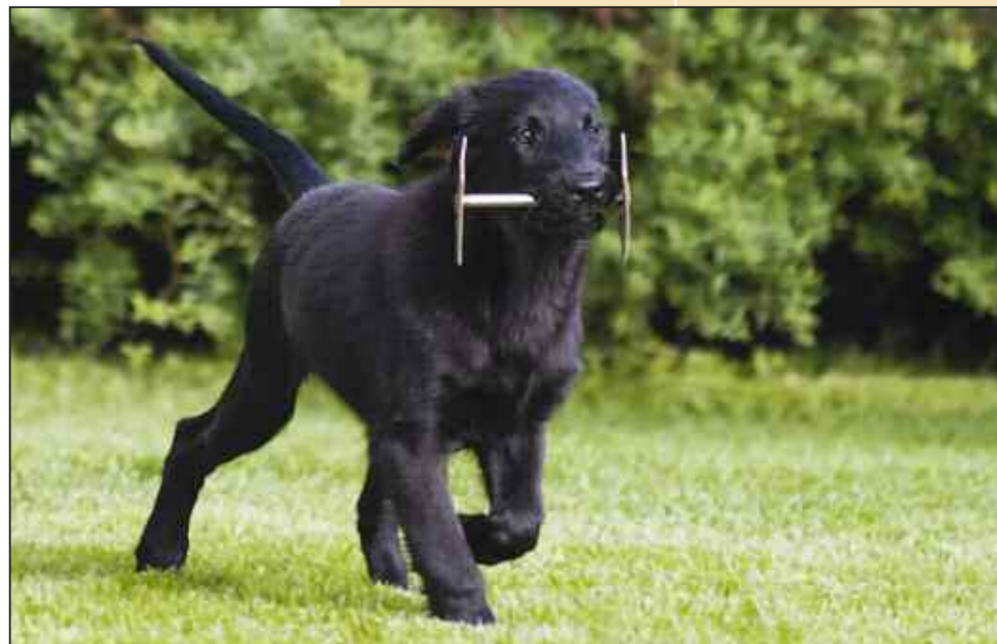
Hunden skal lære å apportere alle slags gjenstander, og i hvilket som helst miljø.

3. Det er heller ikke uvanlig at endel hunder lager seg mønster med å tygge i 2 sekunder, og deretter holde fast korrekt. I tilfeller der et slikt