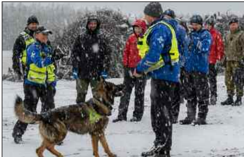
Dagens øyeblikk var når Kronprinsesse Mette-Marit med stor lyst tok en Kong og lekte med Orax, etter å latt seg halse på.